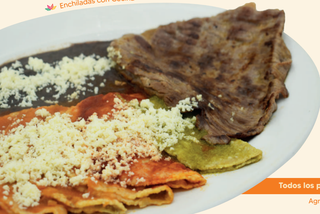
🌶️ Enchiladas con Cecina

Tres enchiladas, tres bocoles rellenos de queso, frijoles y huevos al gusto