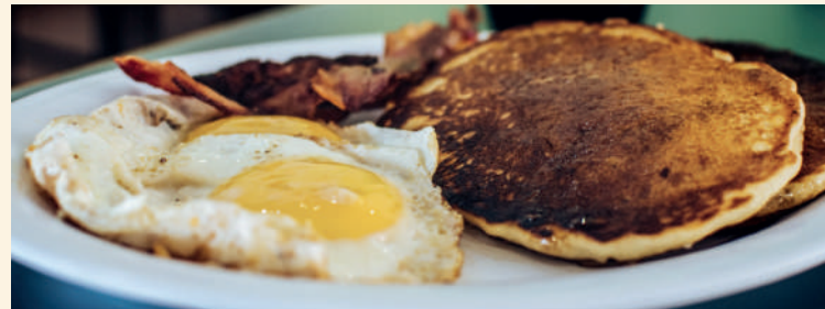
🌶️ Hotcakes Americanos