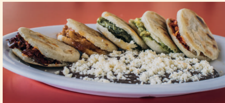
🌶️ Bocoles rellenos